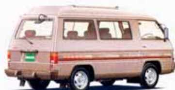
1800ハイルーフGLX EXCEED サンルーフ パワーステアリング付 5速フロアシフト