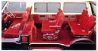
リクライニング可能な前座シートとマルチグレージングシートの組み合わせ。大自然への思いが広がります。