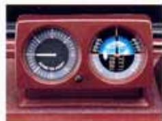
高度計・傾斜計を備えたメーターもって、視野も、もっと遠くへ、もっと速くへ、心がたかまっていく。