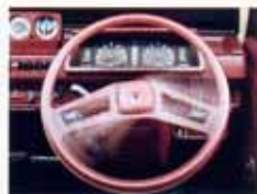
高度計・傾斜計を備えたメーターもって、視野も、もっと遠くへ、もっと速くへ、心がたかまっていく。