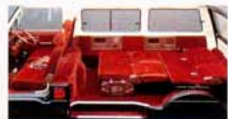
リクライニング可能な前座シートとマルチグレージングシートの組み合わせ。大自然への思いが広がります。