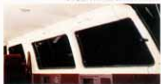
リクライニング可能な前座シートとマルチグレージングシートの組み合わせ。大自然への思いが広がります。