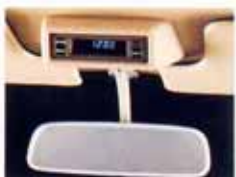
高度計・傾斜計を備えたメーターもって、視野も、もっと遠くへ、もっと速くへ、心がたかまっていく。