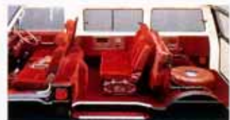
リクライニング可能な前座シートとマルチグレージングシートの組み合わせ。大自然への思いが広がります。