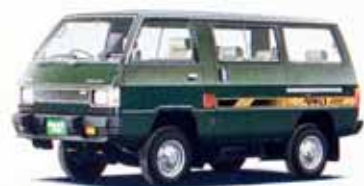
2000・4WD XL-5 5速フロアシフト