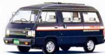
1800ハイルーフGLX サンルーフ パワーステアリング付 5速フロアシフト