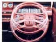
高度計・傾斜計を備えたメーターもって、視野も、もっと遠くへ、もっと速くへ、心がたかまっていく。