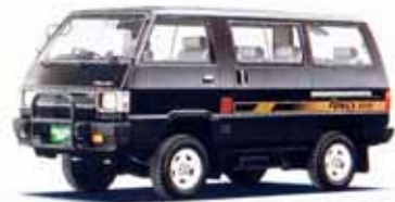
2000・4WD GLX パワーステアリング付 5速フロアシフト