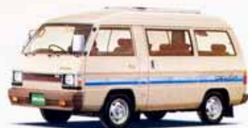
1800ハイルーフGLX EXCEED-A/T サンルーフ パワーステアリング付 3速フルオートマチック