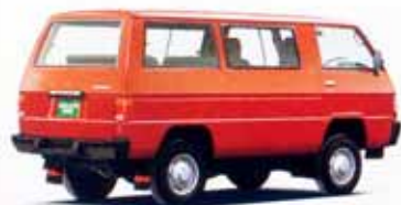
2000・4WD DX-5 5速フロアシフト