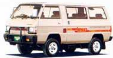
2000・4WD GLX EXCEED パワーステアリング付 5速フロアシフト

4WDか、ハイルーフか。ディーゼルか。ロングボディか。 スターワゴンは、14タイプの豊富なバリエーション。