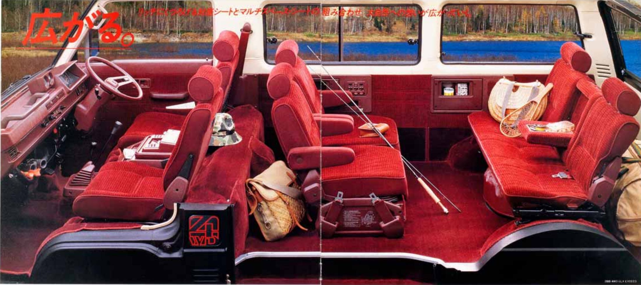
2000 4WD GLX E-KEED

リクライニング可能な前座シートとマルチグレージングシートの組み合わせ。大自然への思いが広がります。