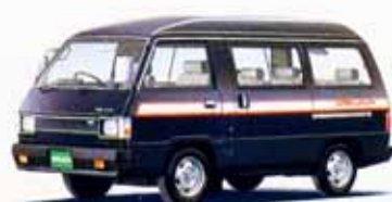
1800ハイルーフGLX パワーステアリング付 5速フロアシフト