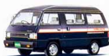
1800ハイルーフGLX-A/T パワーステアリング付 3速フルオートマチック